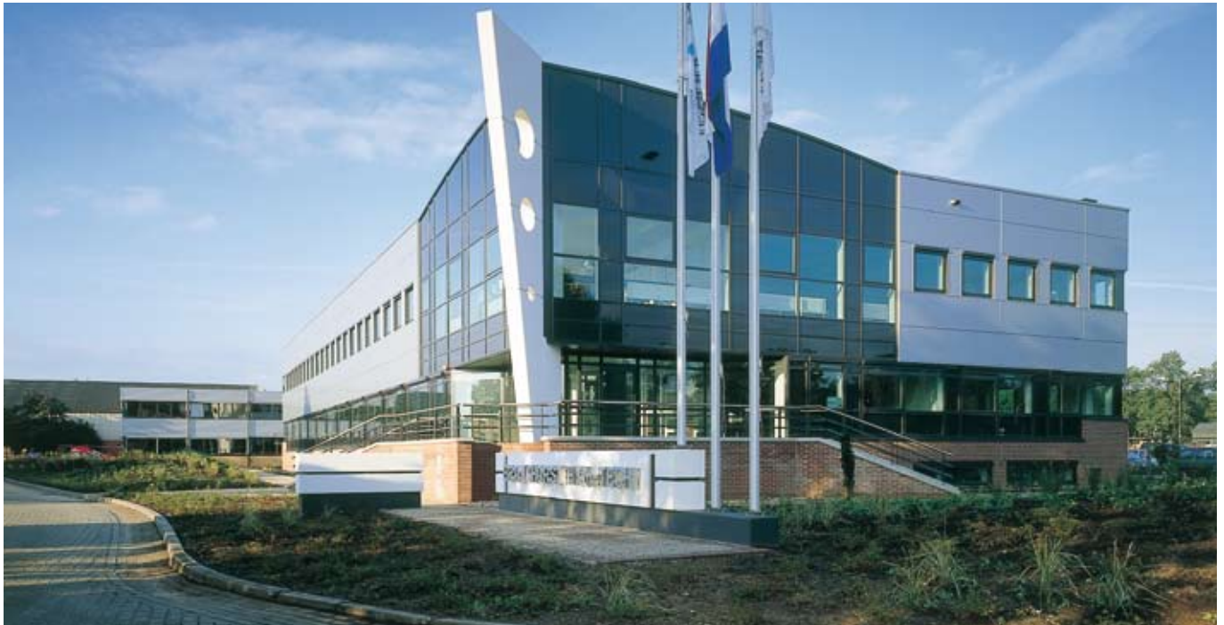
BRONKHORST HIGH-TECH B.V. STAMMSITZ IN RUURLO/NIEDERLANDE